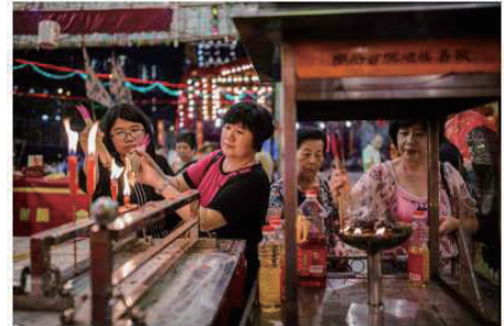
孟蘭節を祝う行事。祈りをささげるため線香へと火をともし人々=11日、香港