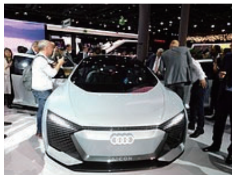
フランクフルト国際自動車ショーを前に、独アウディが公開した完全自動運転の試作車=11日、フランクフルト