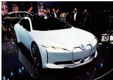
BMWがフランクフルト国際自動車ショーで初公開した電気自動車(EV)スポーツカーの試作車=12日、ドイツ・フランクフルト

【フランクフルト時事】隔年開催のフランクフルト国際自動車ショーが12日、報道陣向けに公開された。電気自動車(EV)や自動運転など注目分野で各社が最新車を展示し、技術やデザインを競う。排ガス不正やカルテル疑惑で揺れた地元ドイツ勢は、名声回復を狙い、アピールに懸命だ。